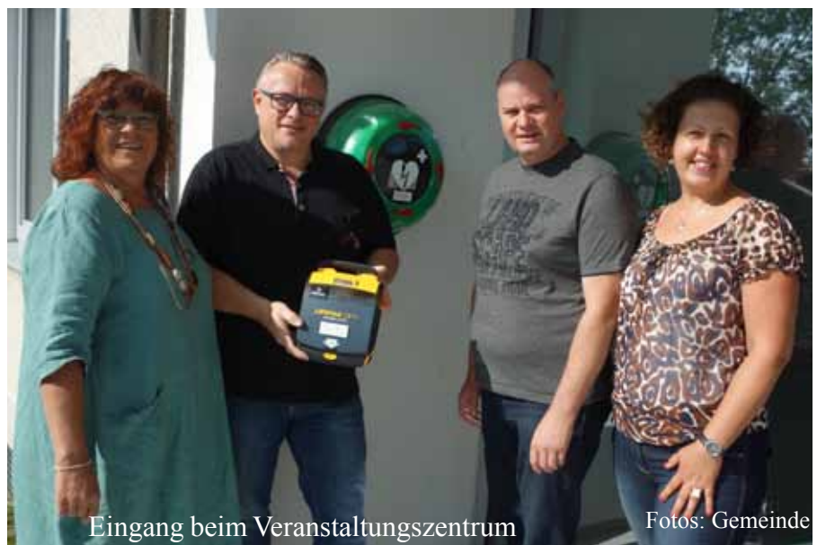
Eingang beim Veranstaltungszentrum