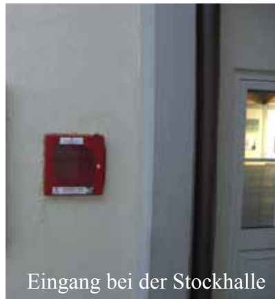
Eingang bei der Stockhalle

Auch durch die neue bauliche Situation war es notwendig, einen besser sichtbaren Platz für diesen Defibrillator zu finden. Als geeigneter Standort hat sich die Wand zwischen Gemeindeamt und Veranstaltungszentrum