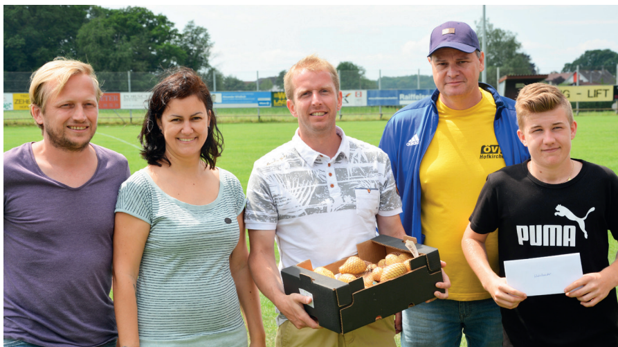
Das Team der Sektion Tennis konnte seinen Titel vom Vorjahr verteidigen!

Besonders erfreulich ist, dass die Ortsbauernschaft als erster Verein die Möglichkeit des Birnstingschießens genutzt hat. Am 22. Juni 2019 haben ab 15 Uhr 14 Personen geschossen. Um 18 Uhr hat das GH Pickl Ripperl in die Kantine geliefert und danach