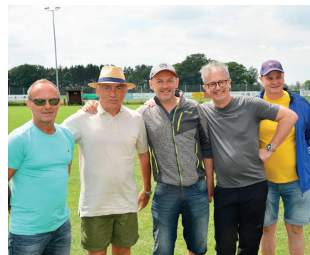
Viele erfolgreiche SU-Mitglieder: drei unter den ersten vier Teams!

wurde von einigen bis 23 Uhr weiter geschossen.