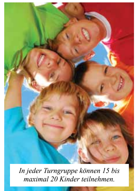
In jeder Turngruppe können 15 bis maximal 20 Kinder teilnehmen.

mittwochs von 16–17 Uhr Kinder von 1,5 bis 3 Jahren (hier wird in Begleitung geturnt)